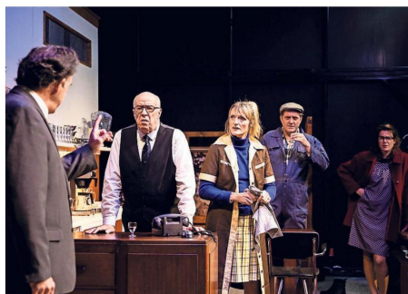
Scène uit 'Gas'.

In de drie delen van elk een uur staat Hotel Boelens in Hoogezand-