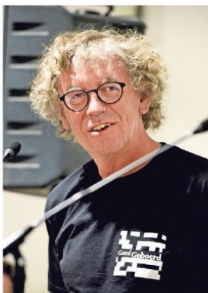
Schrijver Tjeerd Bischoff.