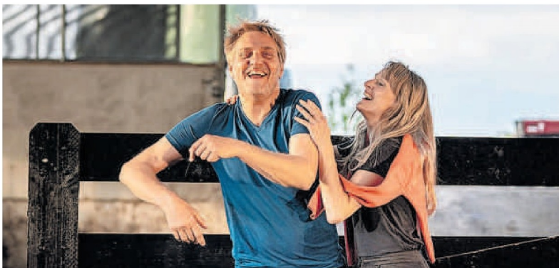
Als puntje bij paaltje komt wat de liefde betreft, wordt toch eerder de ratio gevolgd dan het hart.